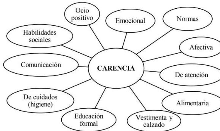
FIGURA 3. Carencias encontradas según las profesionales